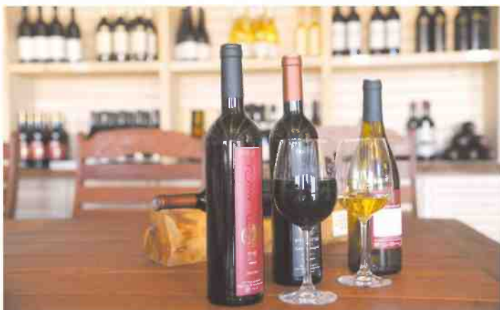
יקב בזלת הגולן. סיורים מודרכים וטעימות