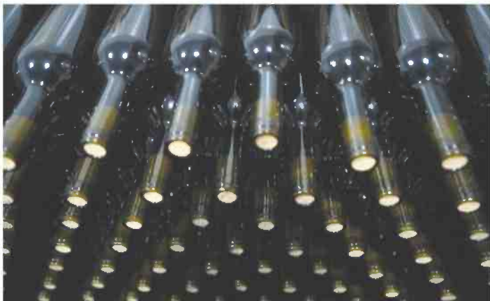
יקב צפיריים. היינות נקראים על שם חורבות האזור