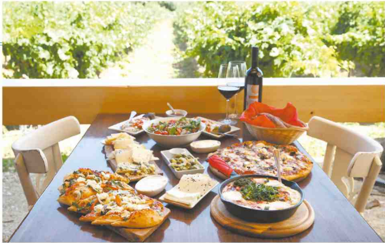
בראנץ' במסעדה של יקב נבות ומבשלת פפו. אפשר ללוות את הארוחה ביין או בבירה צוננת