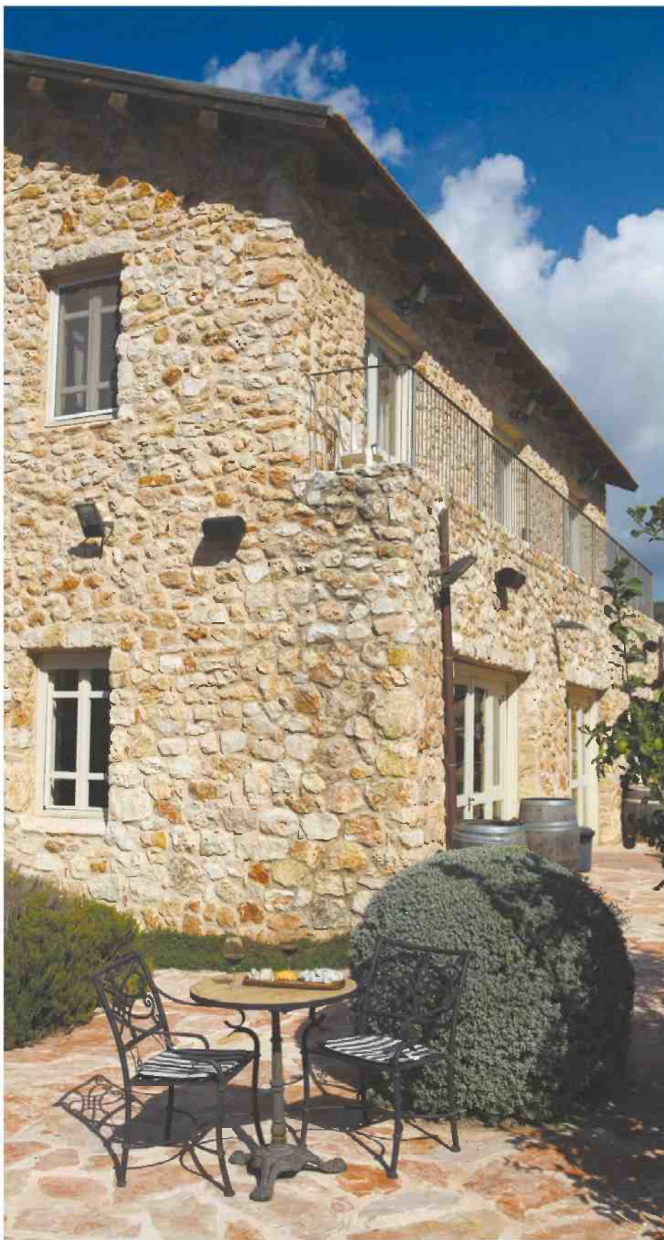
יקב אמפורה. המבנה נבנה בסגנון האופייני ליקבי איטליה