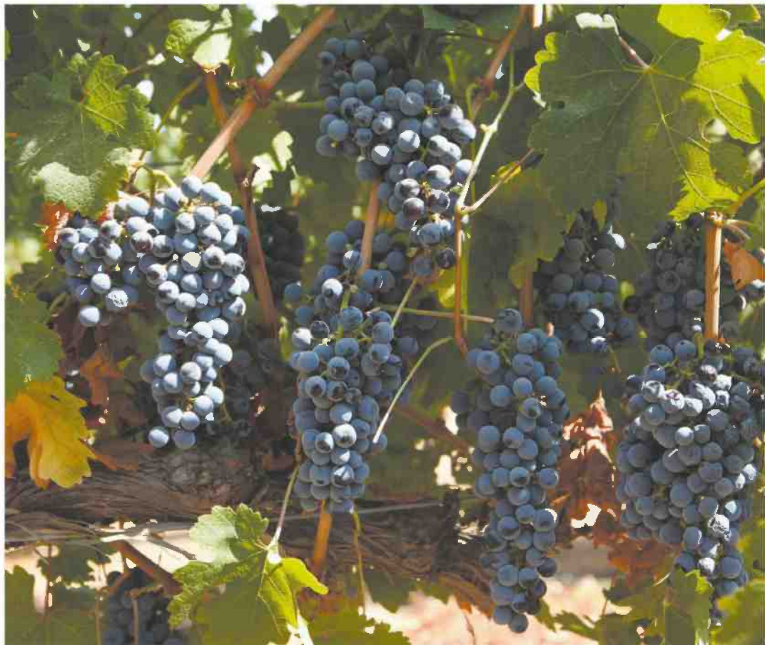
כרמים ביתיה. בחבל גידול גפנים כבר בימי התנ"ך