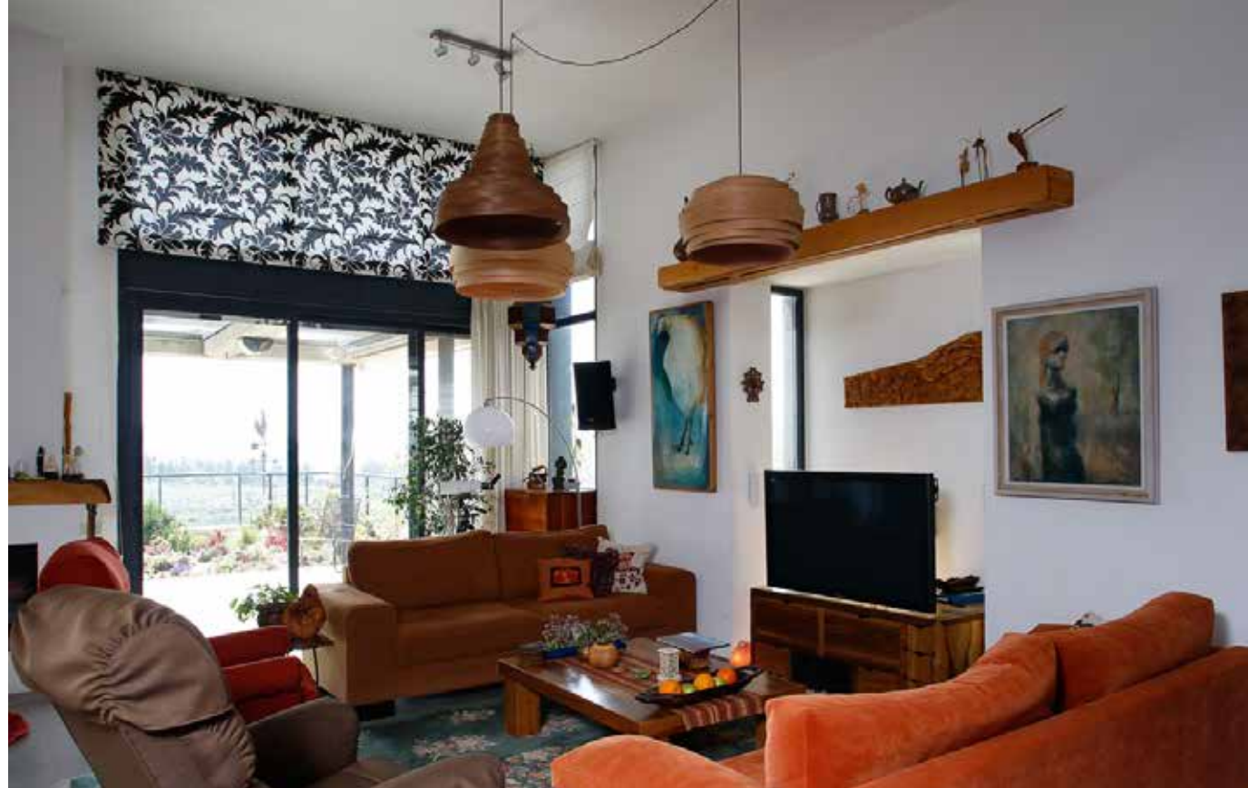
בית משפחת יעלון במושב נווה אילן