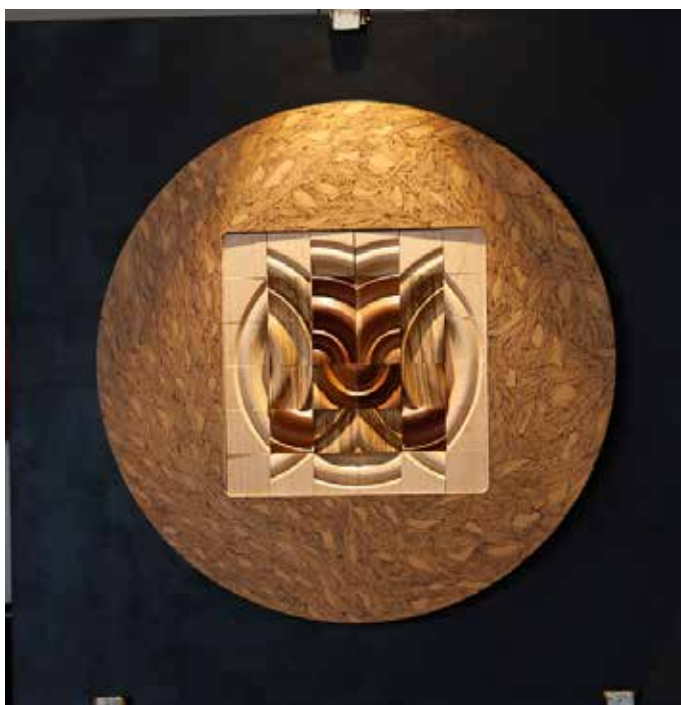
WOOD MELODY 80x80

מאוחר יותר, ומקנה את המסגרת של העבודה שמאפשרת את הגימור הסופי שלה. השיחה עם הזוג יעלון מבהירה לי שכשם שהם מדייקים את אומנותם, ויוצקים לתוכה את המשמעות הייחודית כל כך להם: כך גם משפטיהם, הנבררים