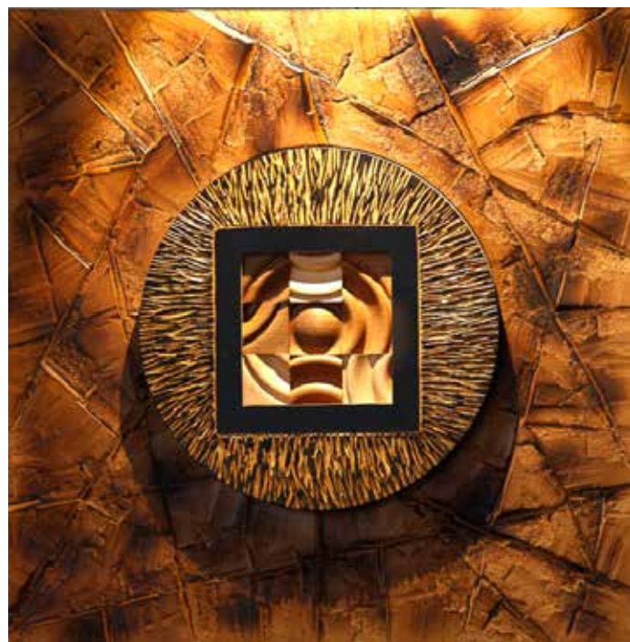
MY WAY 60x60